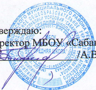
График посещения школьной столовой комиссией (родительский контроль) за организацией и качеством горячего питания